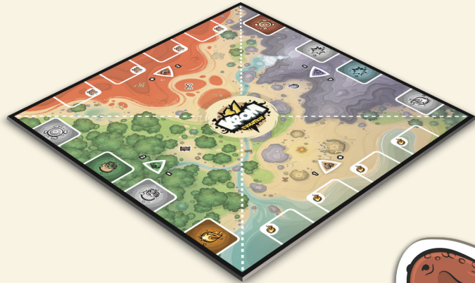
1 DOPPELSEITIGER SPIELPLAN