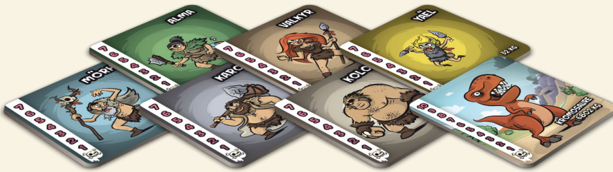
6 CHARAKTERTAFELN + 1 KROMOSAURIERTAFEL